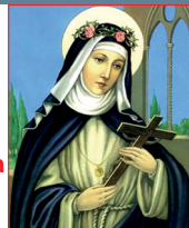
Santa Rosa de Lima