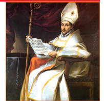
San Leandro de Sevilla