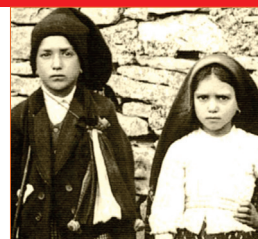
Santos Francisco y Jacinta Marto