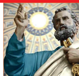
Cátedra de San Pedro, Apóstol