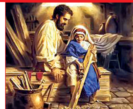
San José Obrero