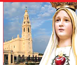
Nuestra Señora de Fátima