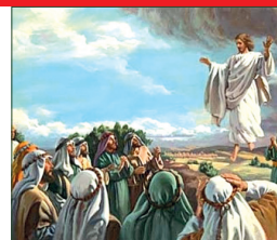
Ascensión del Señor