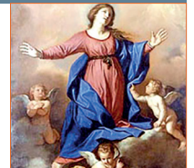
Asunción Virgen María