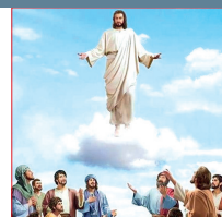
Ascensión del Señor