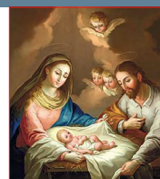
Natividad del Señor